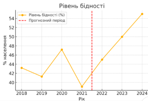
Рис. 1. Динаміка рівня бідності в Україні, 2018–2024 рр.