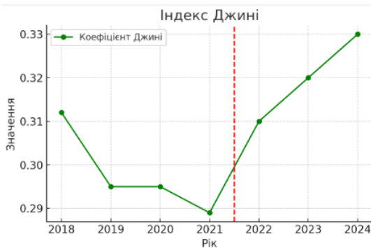
Рис. 3. Динаміка індексу Джині в Україні, 2018–2024 рр.