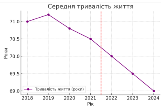
Рис. 4. Динаміка середньої тривалості життя в Україні, 2018–2024 р.