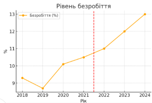
Рис. 2. Динаміка рівня безробіття в Україні, 2018–2024 рр.