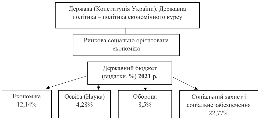
Рис. 1. Державні видатки на ключові сфери економіки в Україні, 2021 р.

Структуру фінансування видатків бюджету в умовах розвитку вітчизняної ринкової соціально орієнтованої економіки потрібно переглядати щодо зміни її пріоритетів і стимулювання бюджетної підтримки окремих економічно активних та інвестиційно перспективних галузей. Ці кроки на загальнодержавному рівні можуть бути не популярними серед населення, оскільки це потребуватиме секвестру видаткових статей бюджету та масштабної економії, але це дасть можливість сконцентрувати необхідний фінансовий ресурс і потенціал для галузей, які в результаті фінансування дадуть необхідний економічний ефект.