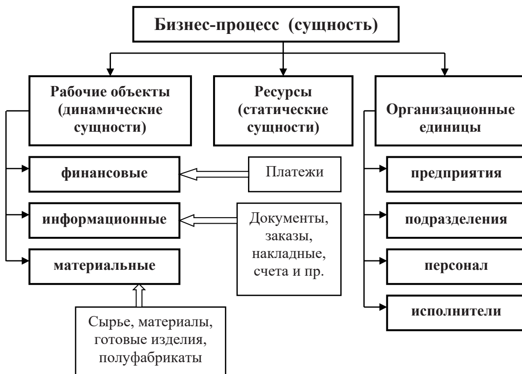
Рис. 3. Состав имущественного комплекса предприятия

Выводы. Таким образом, на основании анализа задач поиска и реализации способов повышения эффективности основных производственных процессов для обеспечения требуемого уровня конкурентоспособности выпускаемой продукции и положительной динамики роста ключевых производственных и экономических показателей предприятия обоснована целесообразность использования объектно-ориентированного подхода в оценке деятельности машиностроительных предприятий.