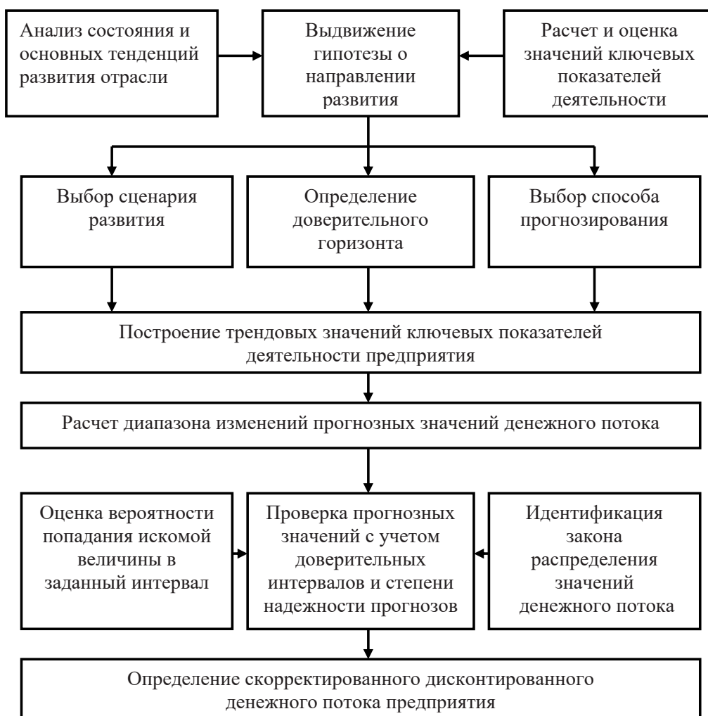
Рис. 2 Взаимосвязь основных этапов прогнозирования денежных потоков предприятий машиностроения

Особое место среди объектов оценки занимает бизнес (предприятие), в процессе определения стоимости которого, объектом оценки выступает деятельность, осуществляемая на основе функционирования имущественного комплекса предприятия и имеющая целью получение прибыли. В состав имущественного комплекса предприятия входят все виды имущества, предназначенного реализации его целей, осуществления хозяйственной деятельности, получения прибыли, а именно: недвижимость, машины, оборудование, транспортные средства, инвентарь, сырьё,