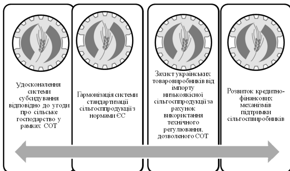
Рис. 2. Напрями удосконалення механізмів державної підтримки розвитку підприємств агропромислового комплексу

Схему удосконалення механізмів державної підтримки стратегічного розвитку підприємств агропромислового комплексу наведено на рис. 2. Слід за-