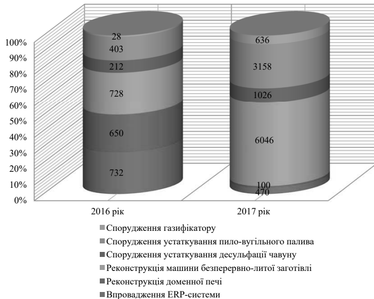
Рис. 3. Витрати на реалізацію інвестиційних проектів на ПАТ «Дніпровський металургійний комбінат» у 2018 р., тис. дол. США

Витрати на реалізацію інвестиційних проектів комбінату в 2018 р. мають таку характеристику [14] (рис. 3).