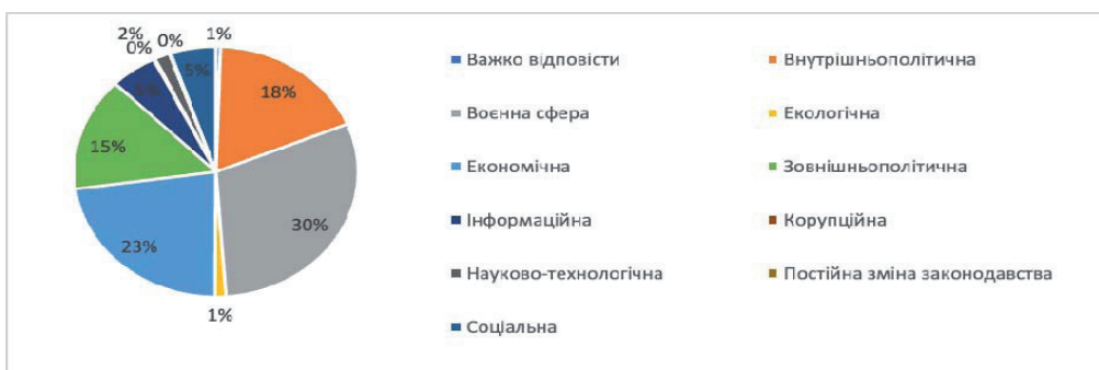
Рис. 4. Аналіз сфер національної безпеки, які на сьогодні найбільш негативно впливає на стан фінансової безпеки суб'єктів підприємництва