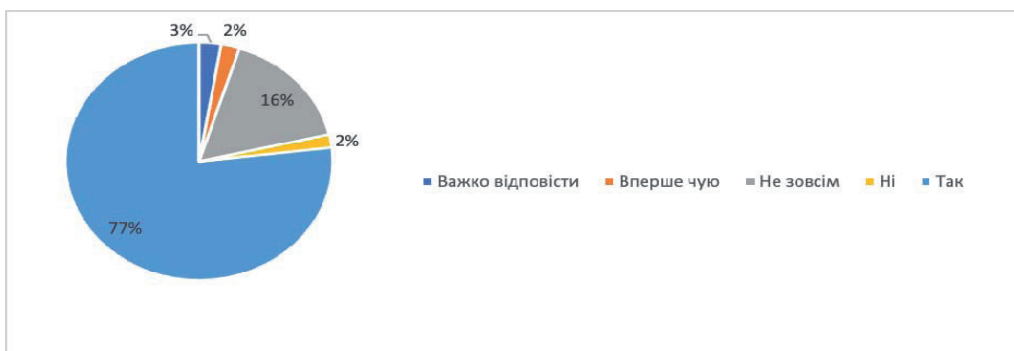
Рис. 3. Ступінь розуміння респондентами поняття «фінансова безпека суб'єктів підприємництва»

Аналіз цієї частини анкетування засвідчив цікаву загальну характеристику респондентів як в регіональному, так і в освітньому (фаховому) рівнях, галузеву відмінність їх економічної діяльності, їх вік, стать тощо. Не менш цікавим став соціологічний зріз обізнаності респондентів щодо сутності фінансової безпеки суб'єктів підприємництва, внутрішніх та зовнішніх загроз, які