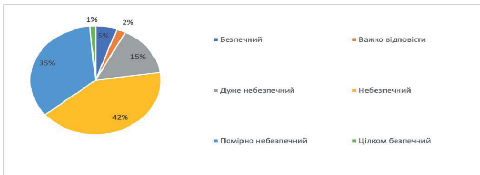
Рис. 5. Оцінка стану фінансової безпеки суб'єктів підприємництва в Україні.