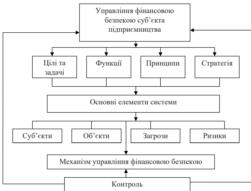
Рис. 1. Схема управління системою фінансової безпеки суб'єкта підприємництва

зниження обсягів виробництва товарів, в тому числі призначених для експорту, збільшення кількості безробітних і відтік персоналу за кордон. Руїнація транспортно-логістичної інфраструктури, пошкодження об'єктів енергетичної інфраструктури, блокування морських торговельних портів, які забезпечували близько 65% зовнішньої торгівлі. Зростання витрат на фінансування сектора безпеки та оборони, а також компенсації громадянам, постраждалим від воєнних дій, веде до значних фінансових збитків.