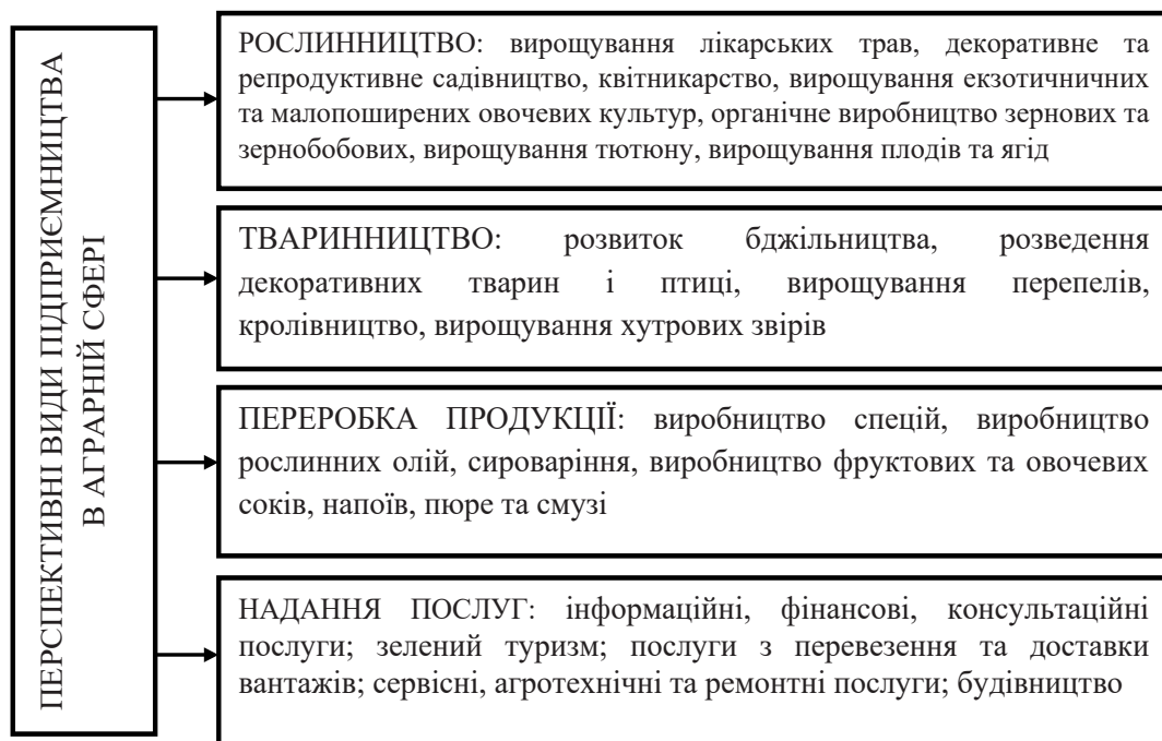
Рис. 2. Перспективні види підприємництва в аграрній сфері Розвинуто ідею [4].

Активізація підприємницької діяльності забезпечує динамізм розвитку національної економіки та виведення її на