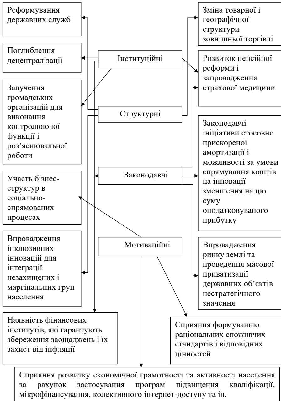
Рис. 3. Інструменти інклюзивного економічного розвитку для України (розроблено автором)

Основною метою вищезазначених дій буде розв'язання завдання виходу на позитивне значення сальдо зовнішньоторговельних операцій, досягнення відносної рівності заощаджень та інвестицій, підвищення інвестиційної привабливості України, зниження соціальної напруженості,