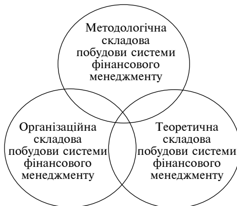
Рис. 1. Взаємодія складових побудови системи фінансового менеджменту для забезпечення синергетичного ефекту

Забезпечення синергетичного розвитку фінансового менеджменту передбачає комплексне врахування різних