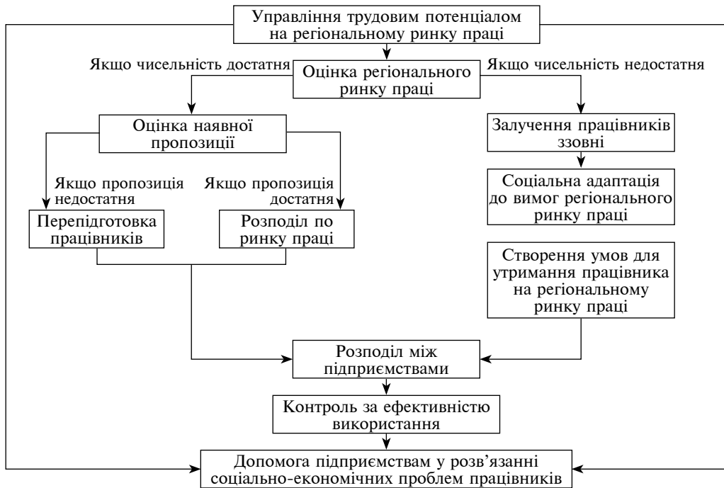
Рис. 4. Схема комплексного управління трудовим потенціалом регіону

вого потенціалу на підприємствах АПК, має враховувати в першу чергу світові тенденції до підвищення вартості робочої сили та її соціального захисту, а також забезпечити значні інвестиції (як державні, так і приватні) у навчання, підготовку та перепідготовку кадрів для сфери АПК згідно ринкових запитів на потребами.