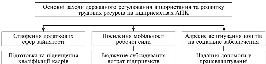
Рис. 2. Схема процесу державного регулювання використання та розвитку трудових ресурсів підприємств АПК

Активними заходами регулювання зайнятості трудових ресурсів вважаються: створення додаткових сфер зайнятості (додаткові робочі місця на державних підприємствах, субсидування, створення нових робочих місць у приватному секторі, створення умов для іноземного інвестування, самозайнятості громадян, організація громадських робіт); підготовка, перепідготовка та підвищення кваліфікації кадрів; посилення тери-