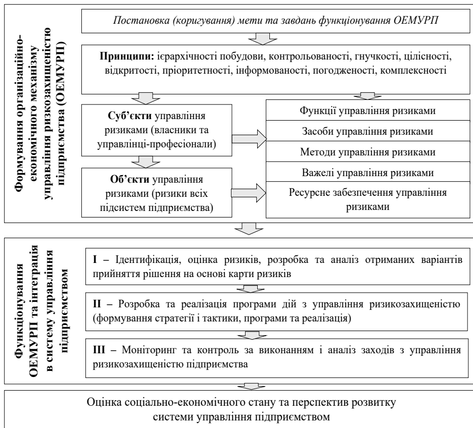
Рис. 2. Організаційно-економічний механізм управління ризикозахищеністю підприємства

Якщо в цій системі якийсь елемент виявиться малоефективним, то вплив недосконалості цього елемента буде відчувати вся система управління і, відповідно, вона буде менш результативною. Тому дуже важливо періодично звіряти міру відповідності один одному елементів системи управління і в разі потреби вносити корективи (рис. 2).