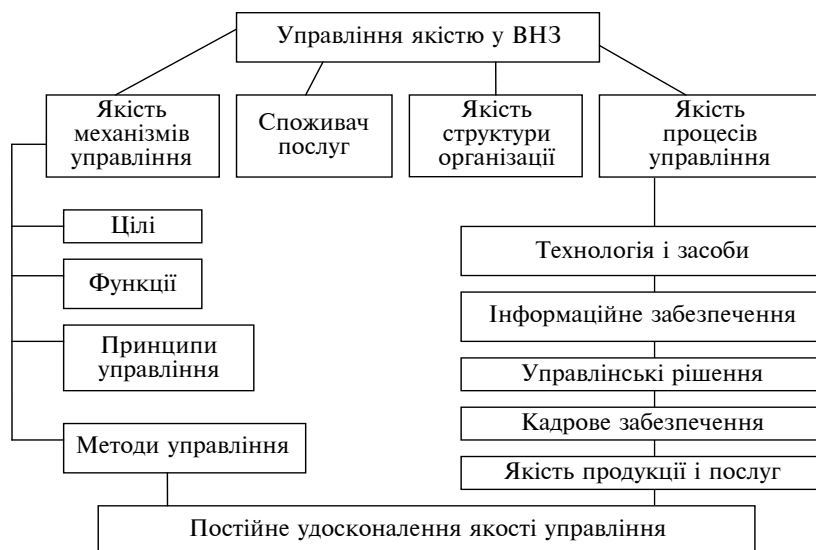
Рис. 3. Система управління якістю у ВНЗ

Висновки. Управління якістю у ВНЗ потребує системного підходу, реалізація